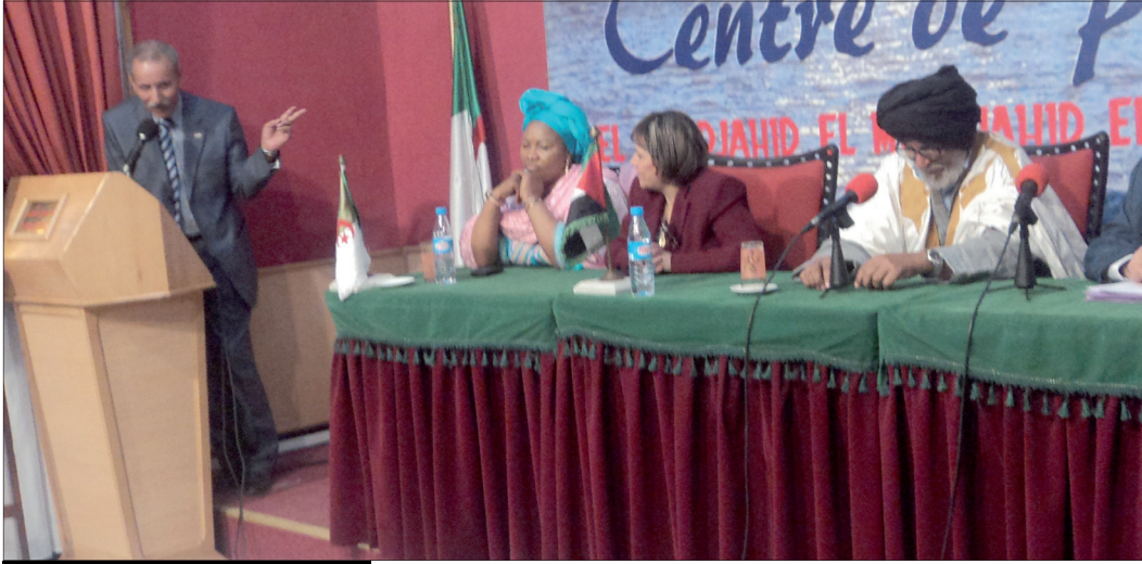
ندوة تضامنية بمقر جريدة المجاهد