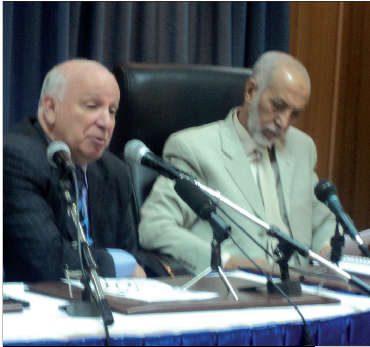
يوم اعلامي لحزب جبهة التحرير الجزائري مع القضية الصحراوية