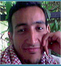
إعداد: ميشان أعلاتي