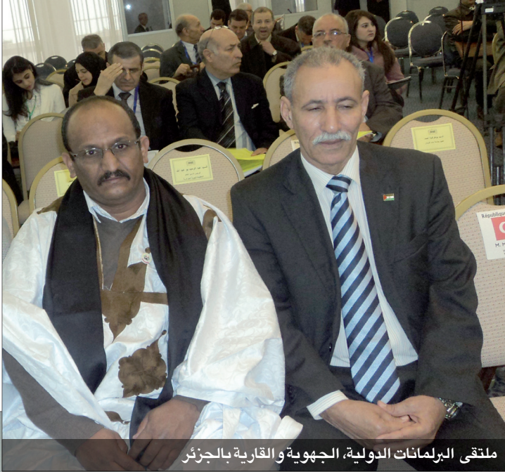
ملتقى البرلمان الدولي، الجهوية والقارية بالجزائر

الجزائريين والاتحاد الوطني للشبيبة الجزائرية وبحضور عدة شخصيات جزائرية وسلطات ولاية عين الدفلة.