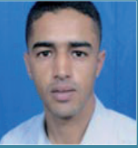
بـقلم: محمد هلاب