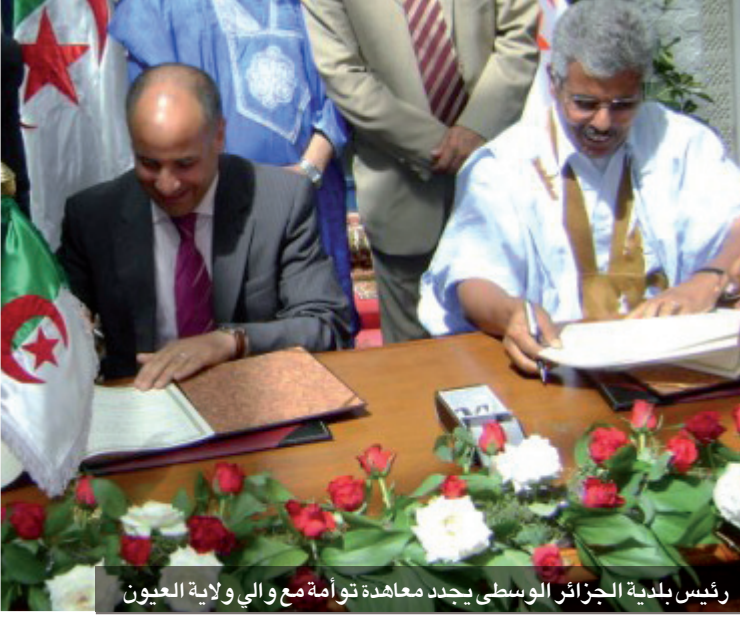
رئيس بلدية الجزائر الوسطى يجدد معاهدة توأمة مع والي ولاية العيون