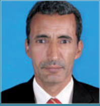
بـقلم: السالك مفتاح