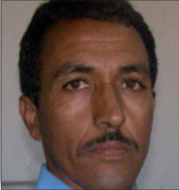
• بقلم: عالي احبابي

حيث تمتع الجميع بحقوق وواجبات متساوية وبعلاقة تقوم على مبدأ أن الناس مواطنين ودولتهم هي الإطار الشرعي والقانوني لهويتهم ، لأجل ذلك يقر الجميع بأن ميلاد الجمهورية مثل العنوان لميلاد مفهوم المواطنة على أنقاض التسبب والتشتت في البلدان المجاورة وجعل من الشعب المرجع والفيصل في تصريف شؤون الوطن وفي مقدمتها الانتخاب الحر المباشر لمن يتولى شؤونه ولمن يمثلونه وله في تجربة مؤتمرات الجبهة الأثني عشر الأسوة الحسنة.