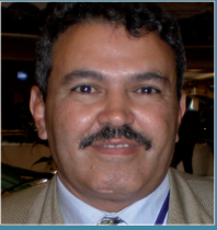
بقلم: محمد اسليمة