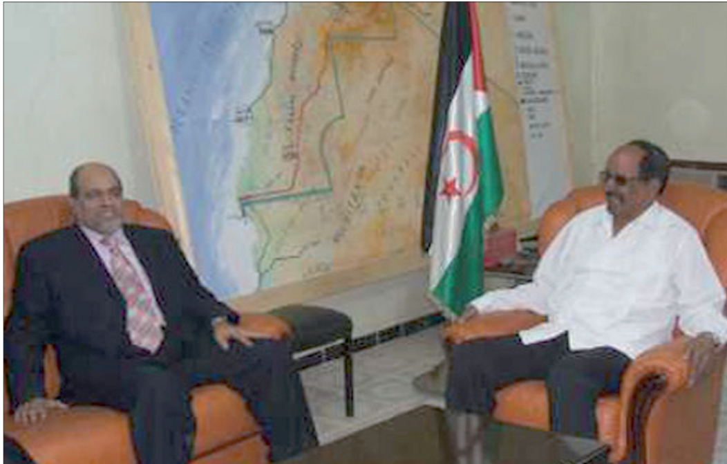
رئيس الدولة يستقبل ابوجرة سلطاني رئيس حركة حماس اثناء زيارته للمخيمات

مهدت السفارة الصحراوية بالجزائر وسهلت في كل النشاطات التي تعرفها الساحة الجزائرية بالتعاون مع اللجنة الوطنية الجزائرية للتضامن مع الشعب الصحراوي، حيث كان لها الدور الفاعل في دراسة ومناقشة القضية الوطنية على مختلف الأصعدة، وفي كافة المحطات والندوات والملتقيات التي من شأنها التعريف بأخر تطورات القضية الصحراوية والرؤى المستقبلية لها.