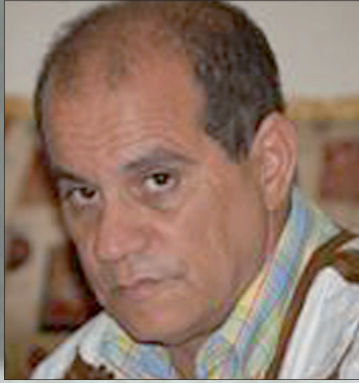
• بقلم: مصطفى الختّاب

من لحظات التاريخ التي لا تنسى تلك التي يضرب فيها موعد لصنع حدث مفصلي ينهي حالة من البؤس والشقاء والحرمان والظلم الممارس، من قبل ظالم متكبر أو قوى شر من نوع آخر، ضد جزء من هذه البشرية التي دأبت على الكفاح من أجل تحسين أحوالها المادية والمعنوية، والانتصار لكرامتها منذ أن وجدت على ظهر كوكبها الأرضي، وستبقى كذلك إلى يوم البعث، منها ما يتحقق بالوسائل السلمية رغم ما يعرفه من إكراهات كثورة المهاتما غاندي، ومنها ما يضطر صانعوه إلى أساليب أخرى من بينها العنف خاصة عندما توصل أبواب النضال والحوار وينكسر المنكبرون ويتجبر الطغاة بالتمادي في طغيانهم وغيهم وضلالهم كالأنظمة الاستعمارية والديكتاتوريات التي اشتهرت بسمعتها وصيتها السيئ، في أوروبا وأمريكا اللاتينية، وبلداننا العربية، وكذا القارة الآسيوية --- الخ-